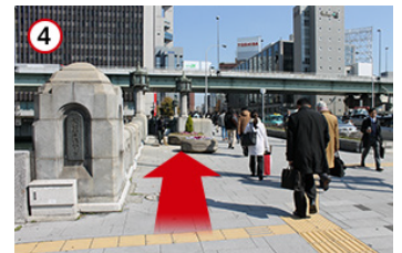
4 大江橋を渡ります。