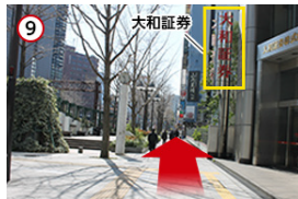
9 「大和証券」を右手に直進します。