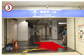
3 北新地駅の地下道に向かう出口を出てから、斜め右方面に向かいます。