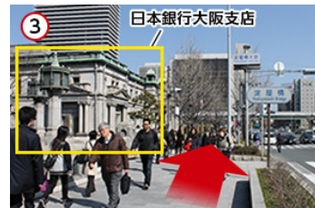
3 日本銀行大阪支店を左手に直進します。