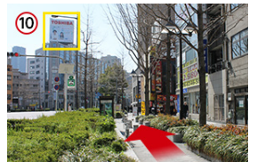
10 「TOSHIBA」の看板が見えるまで歩きます。