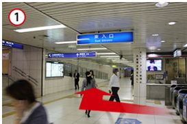
1 JR北新地駅の東口改札を出て右に曲がります。