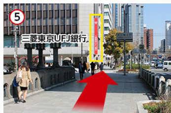
5 三菱東京UFJの看板まで歩きます。