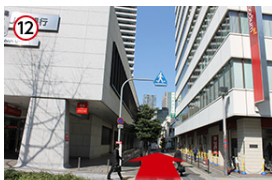
12 三菱東京UFJとfoodiumの間道を直進