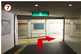
7 看板を右に曲がり、梅田新道交差点を渡ります。