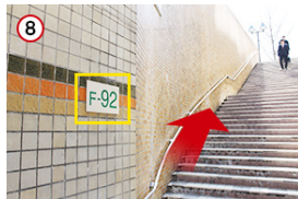
8 F-92出口の階段を上がります。