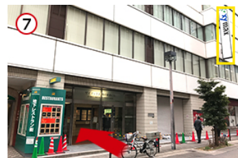
7 「ザイマックス」の看板が見えたら「正面入り口」よりお入りください。