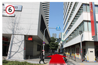
6 三菱東京UFJとfoodiumの間道を直進。