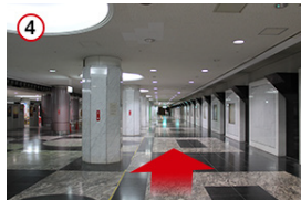
4 こちらの地下道を直進します。