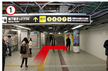
1 淀屋橋駅の7番出口へ向かいます。