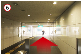
6 エスカレーターを上がり直進すると看板が見えてきます。