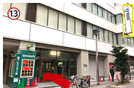
13 「ザイマックス」の看板が見えたら「正面入り口」よりお入りください。