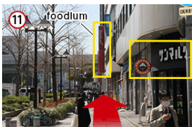
11 サンマルクカフェを右手に直進し、foodiumの看板を目指します。