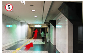
5 突き当りのエスカレーターを上がります。