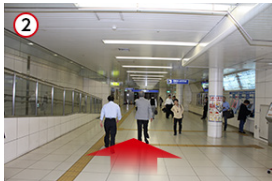
2 御堂筋方面に直進し、北新地駅の地下道を目指します。